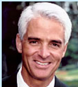
Florida Governor Charlie Crist